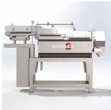
Vista de perfil