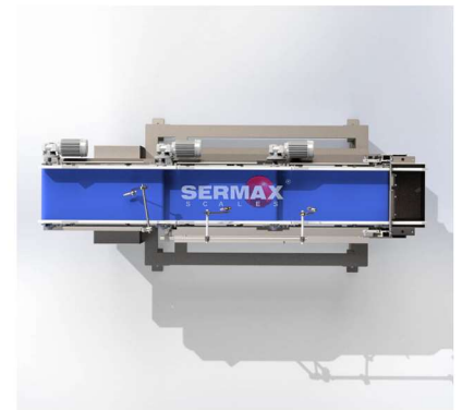
Vista en planta

La gama de pesadoras SERMAX®LWB ha sido diseñada para efectuar dosificaciones entre 5 y 20 L, con transportadores más anchos, mejorando la higiene y seguridad dentro del entorno de pesaje y enfocada en productos adherentes y frágiles, manteniendo al mismo tiempo el alto nivel de precisión requerido.