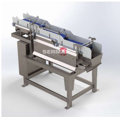
Vista de perspectiva