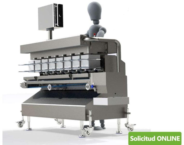
CLM vista de perspectiva ( versión de 8 líneas )