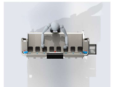
Vista en planta

La gama de pesadoras multicabezales SERMAX ® CLM ha sido diseñada para la obtención de un peso fijo , en la dosificación de productos irregulares extremadamente adherentes y/o frágiles, mejorando la higiene y seguridad dentro del entorno de pesaje. Aprobada como solución con 0% de contaminaciones, altamente higiénica.